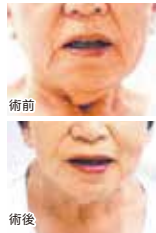
(フェイスリフト) 80歳代 女性の例

大きな効果を誇る、本格的な手術です。ほうれい線も、アゴ周りのたるみも、目尻のシワも、諦めていた悩みがすべてスッキリ! 10歳前後若々しく変身することも夢ではありません。 料金：1,000,000円～1,600,000円