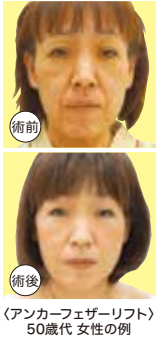
(アンカーフェザーリフト) 50歳代 女性の例

また、軟骨を通すため、細く長い特殊な針を使用しなければならぬのですが、それを指先だけでつまんで、細い糸を皮下組織に絡ませるために、ウェーブさせて通さないといけませんので、熟練した当院専門医に行えない治療です。